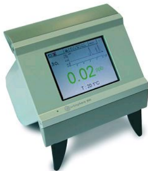
アナライザー本体（表示部） モデル 510