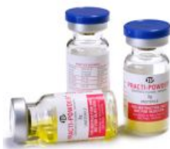
液体または粉体のバイアル