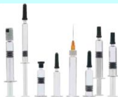
プレパック・シリンジ