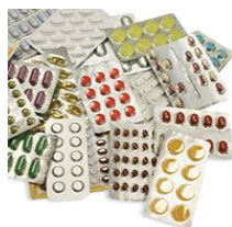
アルミパックの錠剤