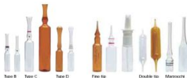
各種形状のアンプル